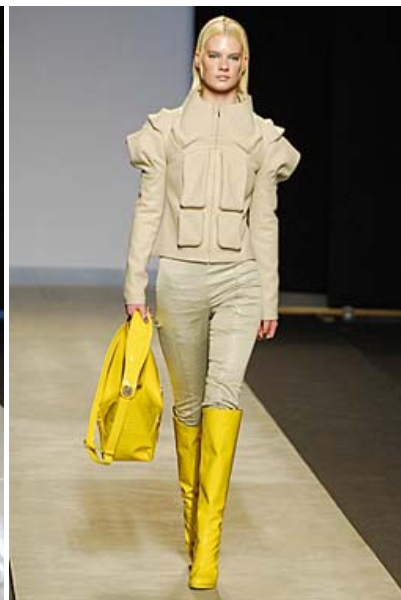
Diseño de DEVOTA & LOMBA con pieles de