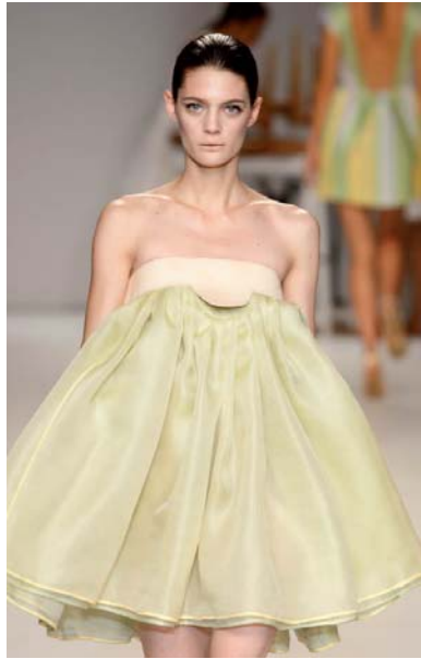
Creación de Devota & Lomba con pieles de Miret y Cía