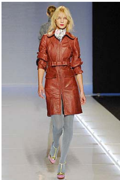
Creación de Devota&Lomba con pieles