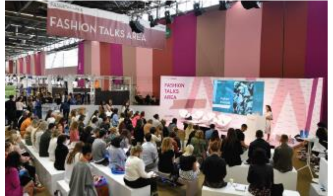
FASHION TALKS AREA