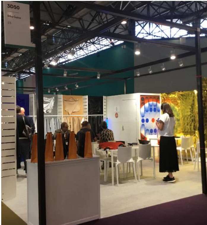
Pie de foto: Stands de empresas Ribba Guixà y pieles en el stand de La Doma en la pasada edición de PREMIERE VISION LEATHER