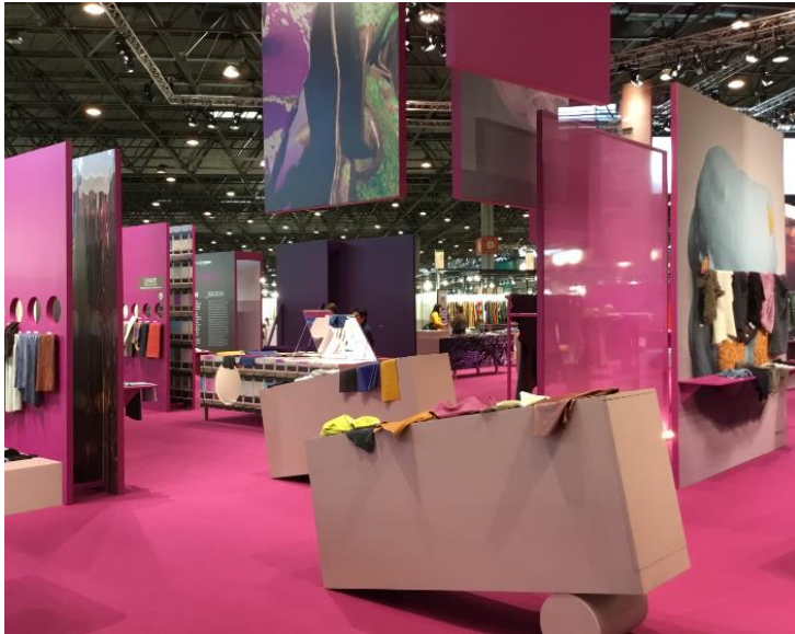
Area Trends Gallery Fall/ Winter 2020/21